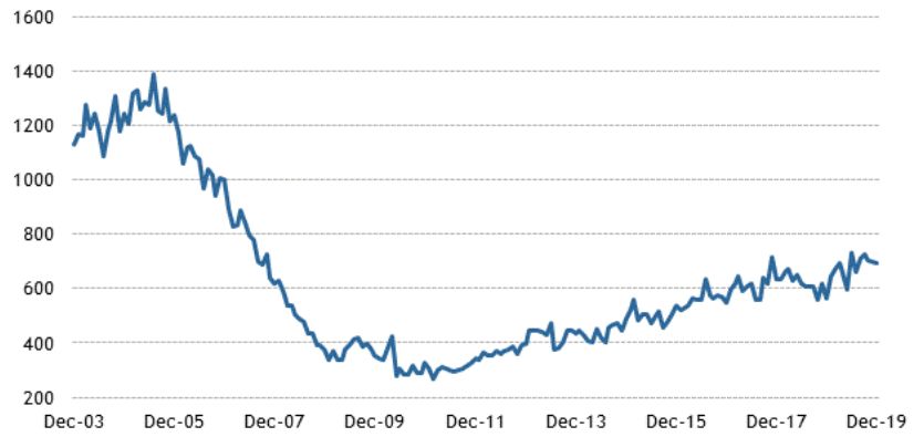
New Home Sales (thousands, SAAR)

Geçen hafta 1.420 M beklenen ABD Ocak konut başlangıçları -3.7% ile 1.567 M olarak gerçekleşti (halen 2. en hızlı gidişti).