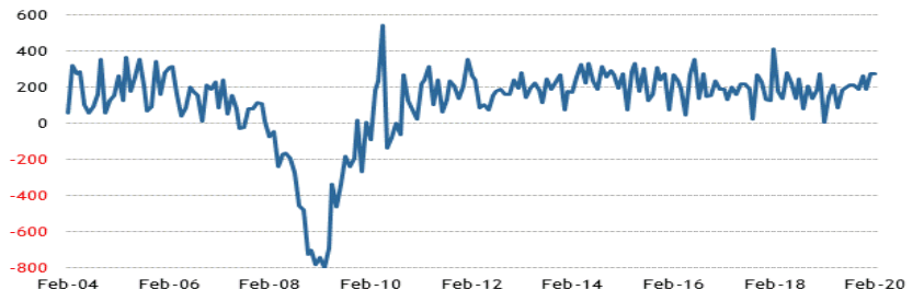
Nonfarm Payroll Change (thousands, SA)

; updated 03/06/20